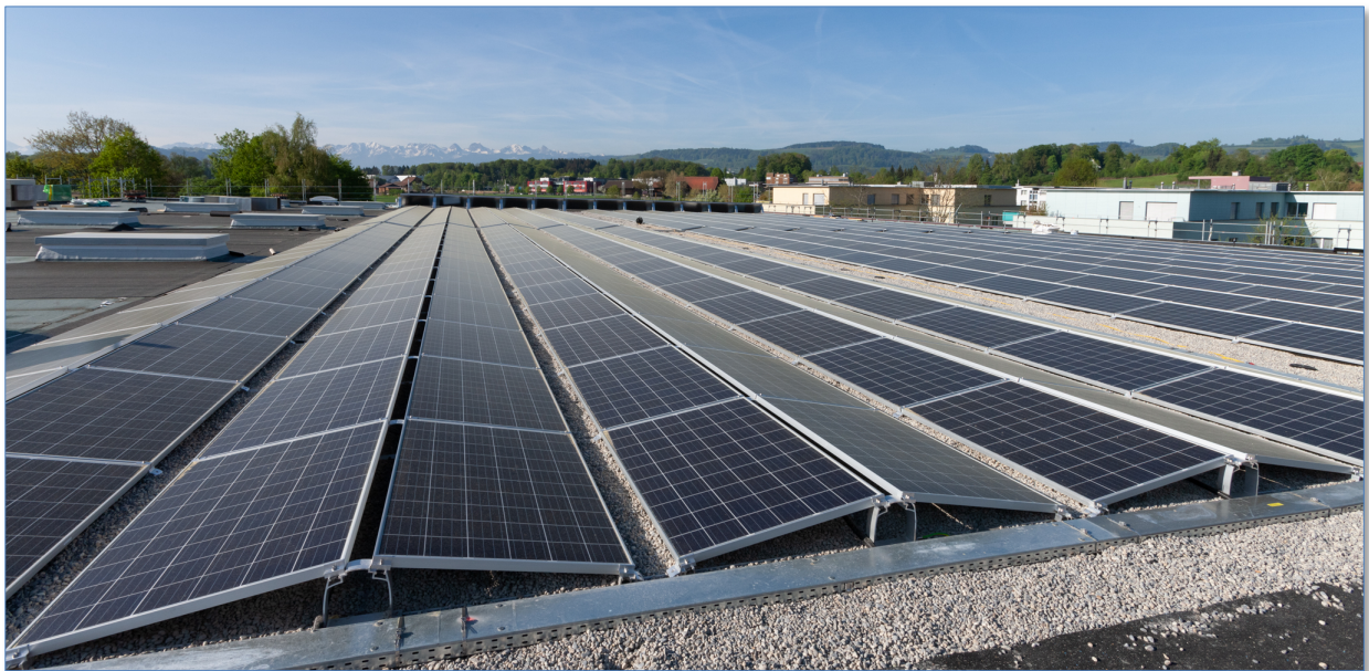
792 Solarmodule mit einer Gesamtfläche von rund 1.500 m 2

Auf dem Dach wurde eine West/Ost Aufdach-Anlage montiert. Sie besteht aus 792 Solarmodulen mit einer Gesamtfläche von ca. 1'500 m 2 . Die installierte Anlage wird eine Gesamtleistung von rund 204.000 Kilowattstunden pro Jahr erbringen, was dem Energiebedarf von rund 50 Einfamilienhäusern entspricht. Die Solarmodule auf dem Dach produzieren Gleichstrom. Im Technikraum wird dieser Gleichstrom mit vier Wechselrichtern in Wechselstrom umgewandelt, bevor er dann ins Netz gespiesen wird.