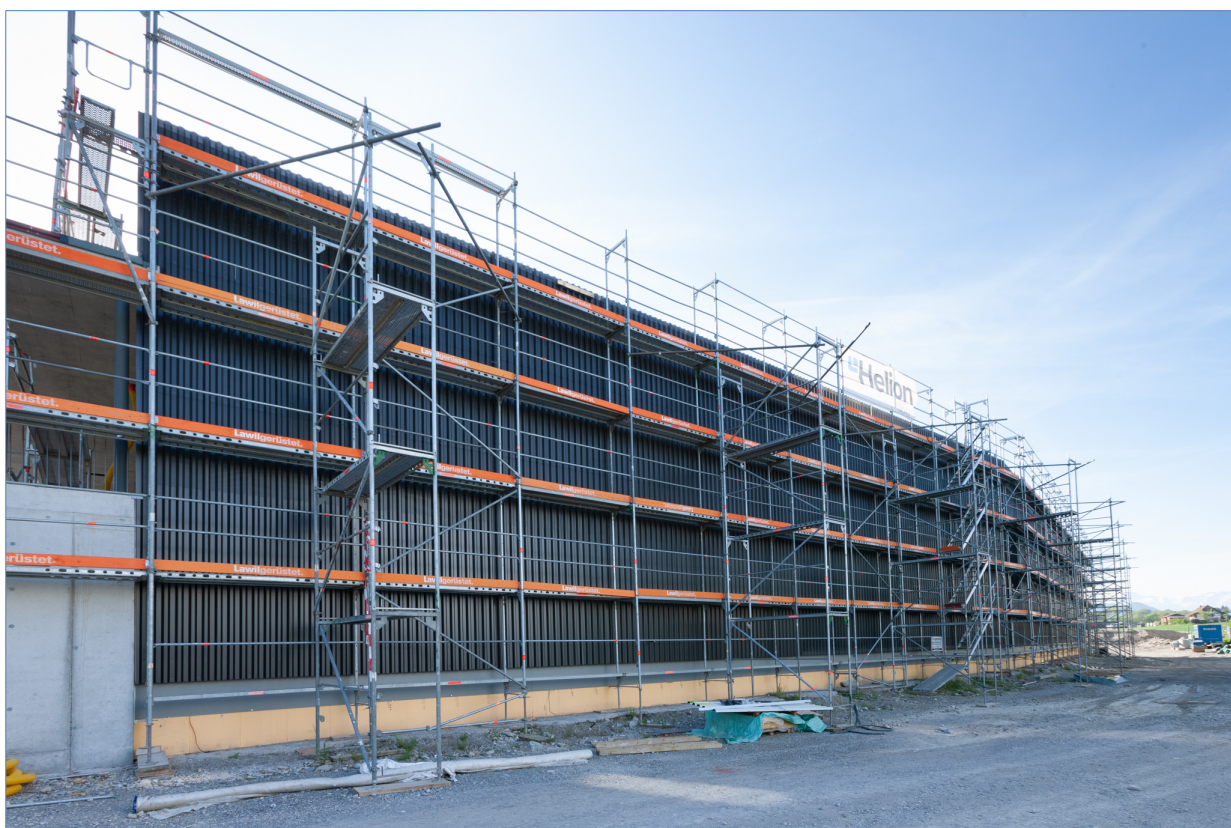
... und die Westseite