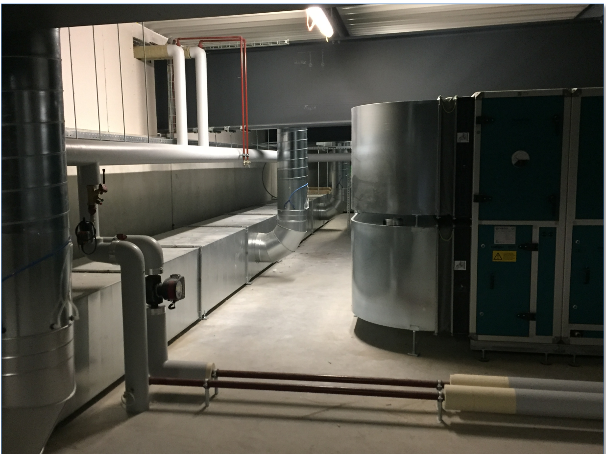
Ein Blick in die Lüftungszentrale

In der Lüftungszentrale wähnt man sich je länger je mehr wie in einer Industriefirma.