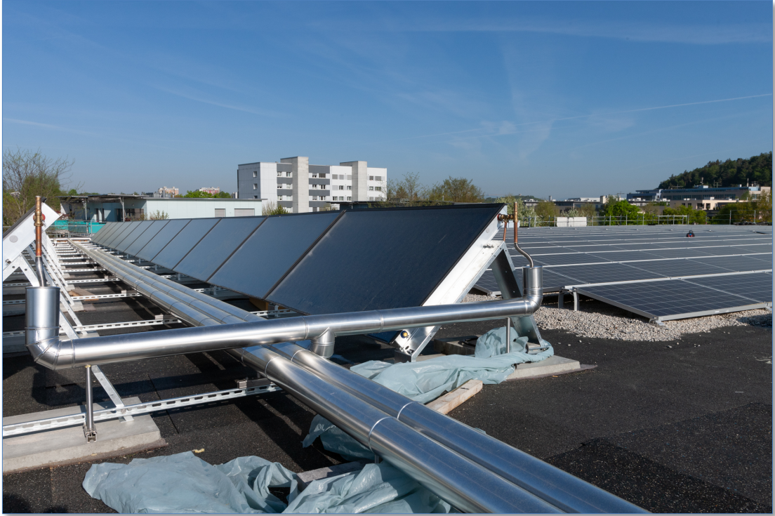
Die 24 Sonnenkollektoren für die Warmwasserproduktion