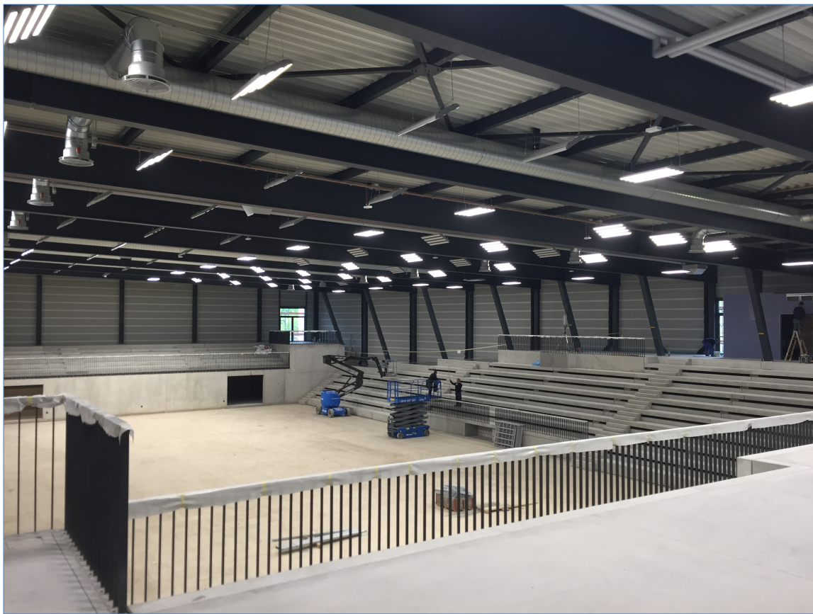
Die Installation der Hallenbeleuchtung hat begonnen