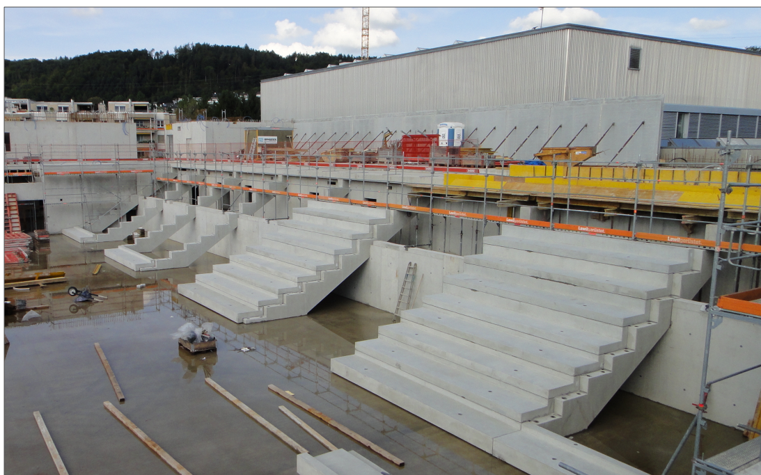
Die Baustelle Ende August 2017