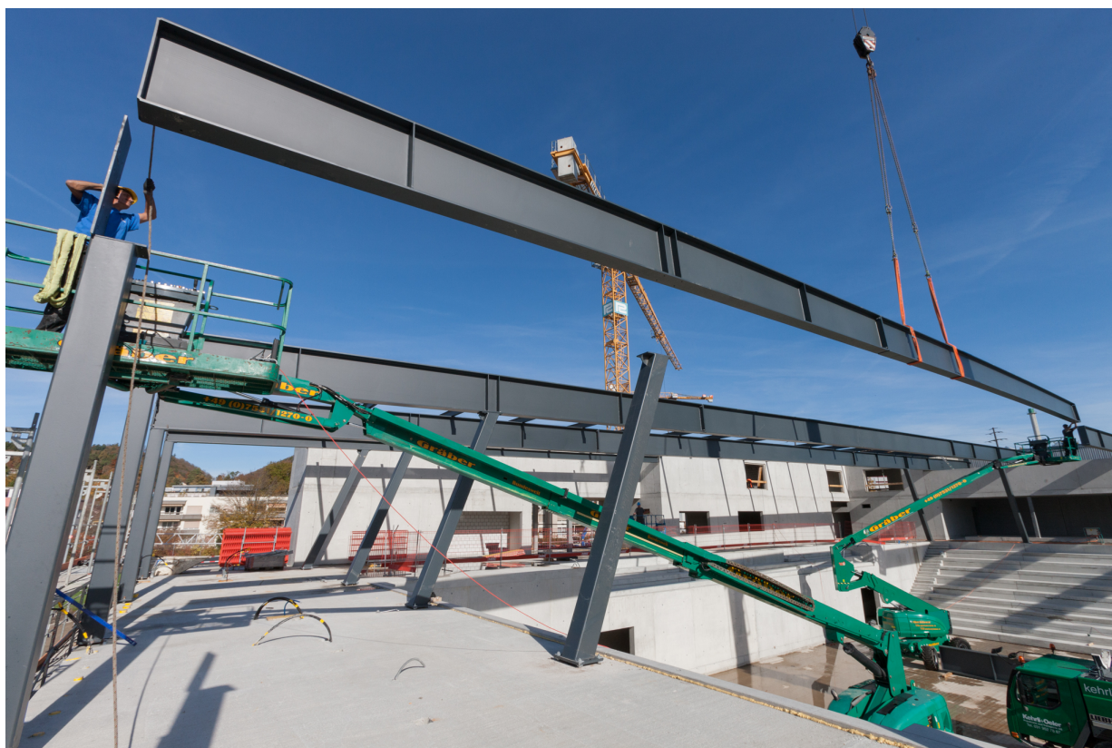
Die Montage der Stahlkonstruktion des Hallendachs