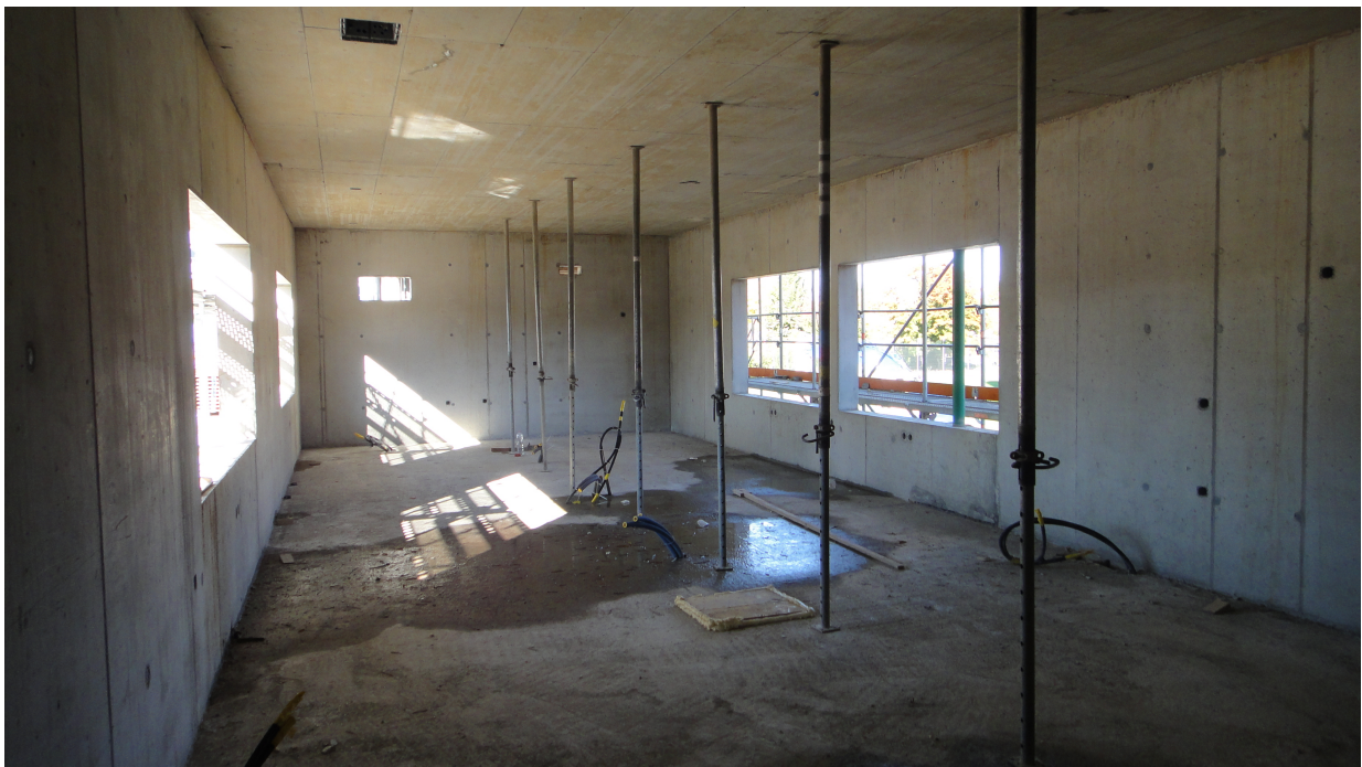
Die grosse Buvette im Eingangsbereich mit 4 Ausgabefenstern