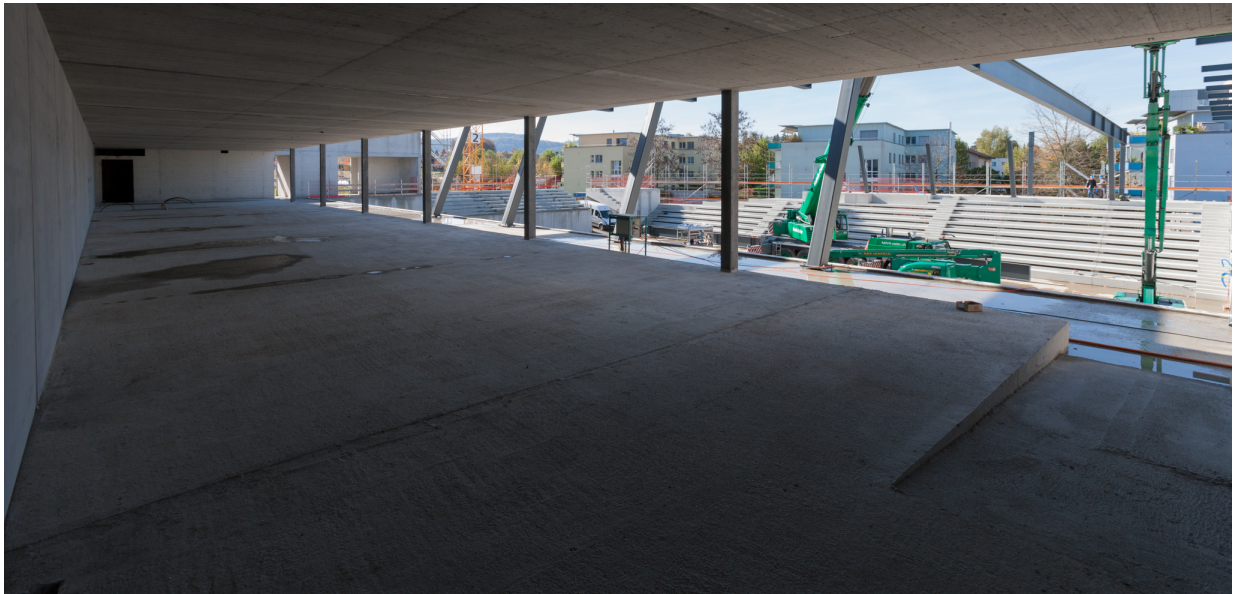
Ein Eindruck vom künftigen grossen Restaurant der Bärenclub-Lounge.

Parallel dazu wurde im künftigen äusseren Eingangsbereich der Ballsporthalle mit der Erstellung der Zugangsplattform begonnen. Auf der ganzen Länge der Frontseite der Halle wird eine gedeckte Plattform mit einer Art Vorplatz zu den Hallen-Eingängen erstellt. Auf der linken Seite erreicht man die Plattform über eine Rampe und auf der rechten Seite über eine breite Treppe.