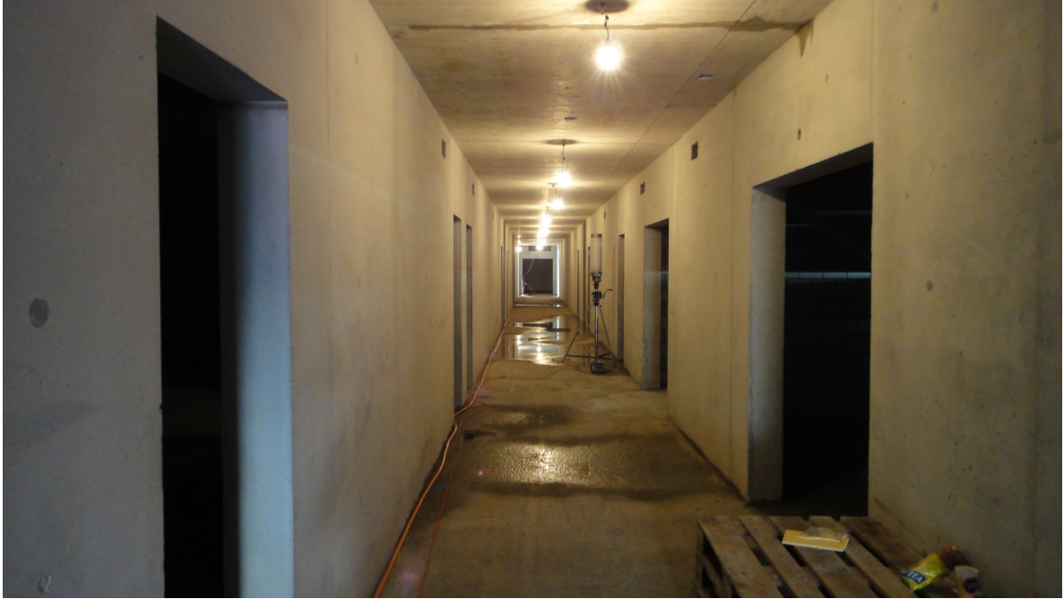
Blick in die "Innereien" der Ballsporthalle