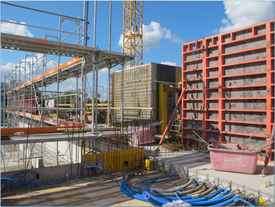
Impressionen von der Baustelle