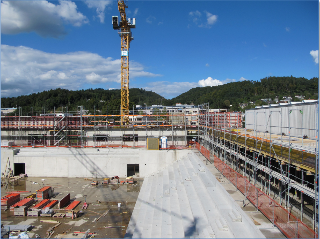
Das künftige Restaurant der Bärenclub-Lounge rechts oberhalb der Längsseite der Ost-Tribüne