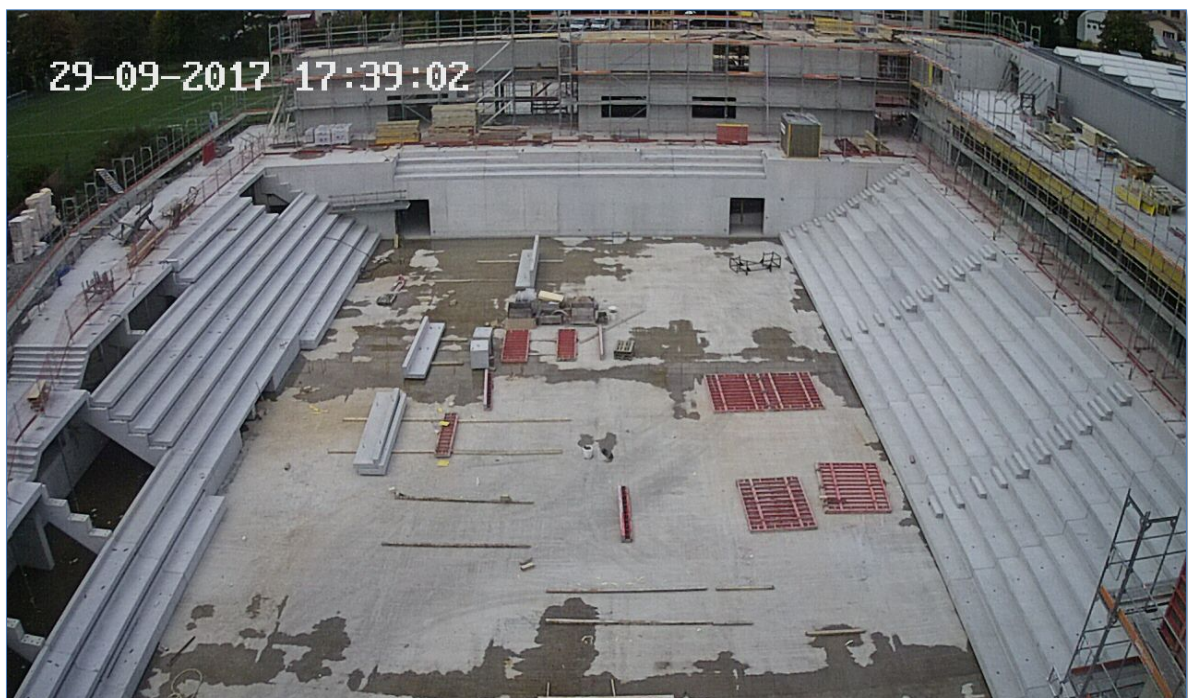
Die Baustelle Ende September 2017