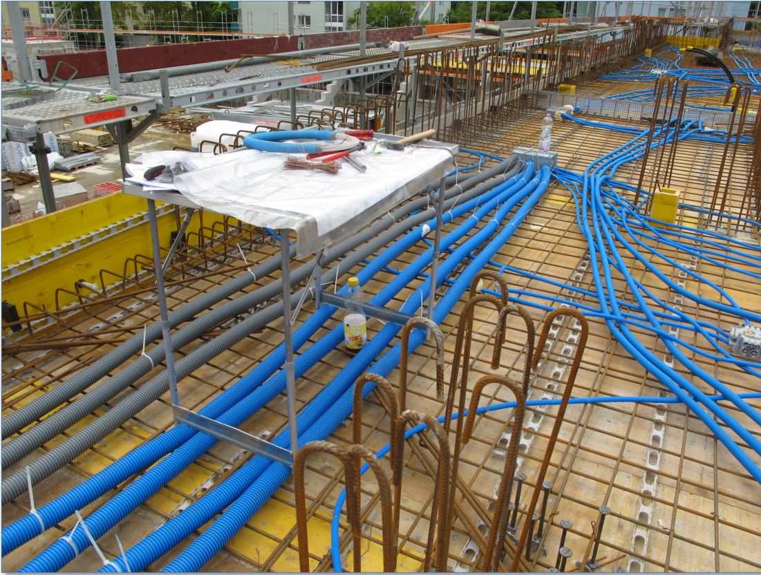
Die Vorbereitungen für den Bau der Bodenplatte des Erdgeschosses oberhalb der West-Tribüne

Vor dem Betonieren der Bodenplatten müssen zwischen dem Armierungsstahl sämtliche Leitungen und künftigen Anschlüsse verlegt sein.